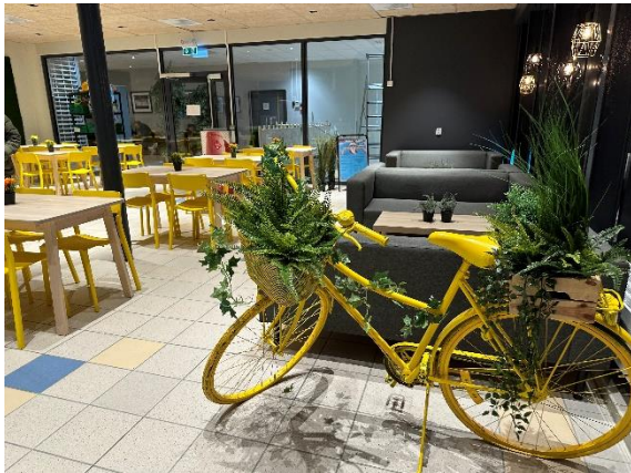
Hovedkafe, inngang A – Bodø Spektrum.

TUR kafè er en del av Bodø Bakeri og er Bodø svømmeklubb sin samarbeidspartner på servering under NM Svømming 2024. Vi er etablert i Bodø spektrum med to utsalgssteder. Sammen med Bodø Svømmeklubb skal vi sørge for at dere får i dere god mat til lunsj under arrangementet.