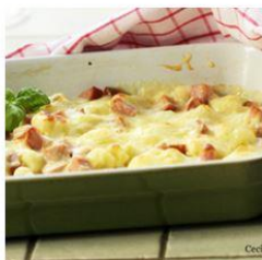
17/11 Gratinert blomkål